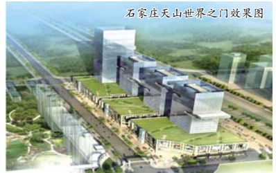
石家庄天山世界之门效果图

融心、创业谷、自贸港、未来城五大核心板块,由此汇聚成一座充满活力的、多元的时代之城。特别是随着“十三五”期间国家京津冀协同战略的进一步实施,使项目建成后的发展前景更为广阔。